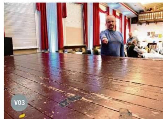
Der Bühnenneubau soll in der Spielpause im Sommer erfolgen. Im September soll die neue Bühne dann mit einer Sonderveranstaltung eingeweiht werden.

Das wird ein umfangreiches Unterfangen. Um den alten Boden zu entfernen, muss zunächst ein Teil der Traversen, an den die Bühnenscheinwerfer montiert sind, sowie Teile der Vorhangaufhängung abmontiert werden. Bei der Gelegenheit soll auch die Bühnen-elektrik überprüft und modernisiert werden. Ein Blick hinter die Bühne, der dem Theaterbesucher normalerweise verwehrt bleibt, zeigt, dass dort noch alte Seilzüge und mechanische Einrichtungen vorhanden sind, die irgendwann stillgelegt wurden. „Wir werden den kompletten Holzaufbau neu machen. Der Unterbau kann hoffentlich erhalten bleiben“, beschreibt Ute Scholz die geplanten Maßnahmen.